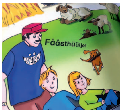
Friesisch-Unterricht an den Schulen stärken