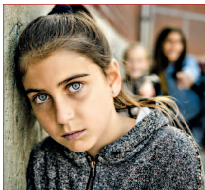
Neue Erkenntnisse über Gewalt in der Schule