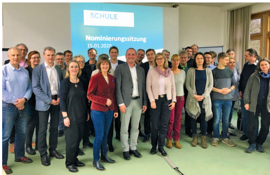
Nach eingehender Prüfung der Bewerbungen haben die Jurymitglieder zwölf Schulen für die Endrunde nominiert.

Unter dem Motto „Demokratiebildung in Schule und Unterricht“ wird in diesem Jahr das vierte Mal die Schule des Jahres ausgelobt. Mit drei attraktiven Preisen sollen herausragende Leistungen von Schulen in besonderer Weise gewürdigt werden: Der 1. Preis ist mit 12.000 Euro dotiert, der 2. Preisträger erhält 8.000 Euro und der 3. Preisträger 6.000 Euro. Zudem vergibt der Ministerpräsident des Landes Schleswig-Holstein Daniel Günther erstmalig einen Sonderpreis von 5.000 Euro für ein be-