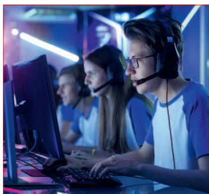
2. eSport-Meisterschaft für Schulen